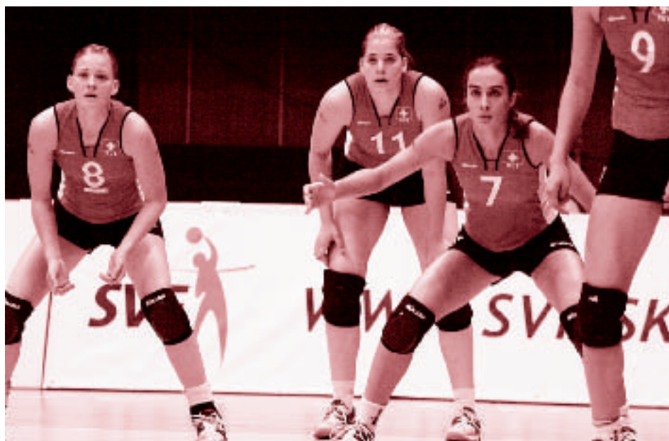
Volle Konzentration – bei den Juniorinnen der Schweizer Nationalmannschaft.