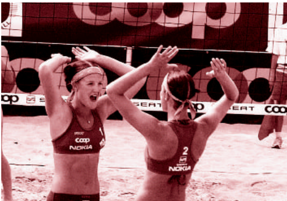
Im Beachvolleyball ist die Schweiz Weltklasse.