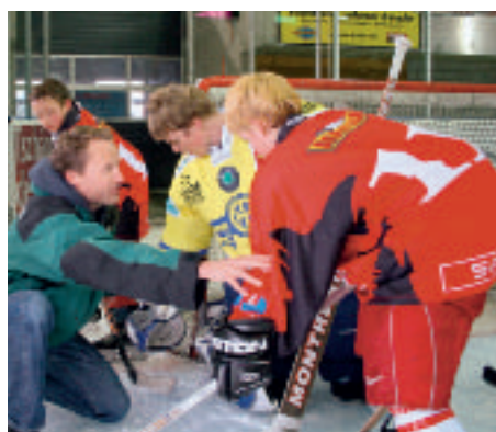
Fotoshooting mit HCD-Keeper Jonas Hiller.

Eines ist jetzt schon sicher: auf dem Sportheilf Kalender 2006 werden wiederum fantastische Bilder voller Emotionen zu sehen sein. Das freut nicht nur den Betrachter, sondern auch den Sportnachwuchs, dem der Erlös zu Gute kommt.