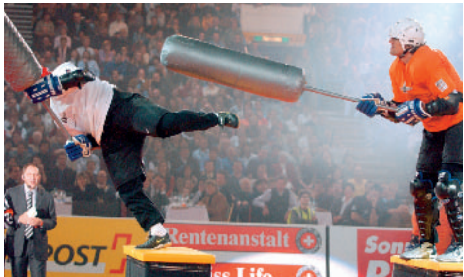
Action im Hallenstadion: Die Sportstars werden alles geben.