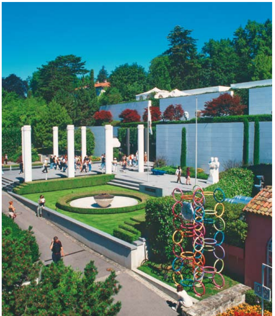
Das olympische Museum in Lausanne.