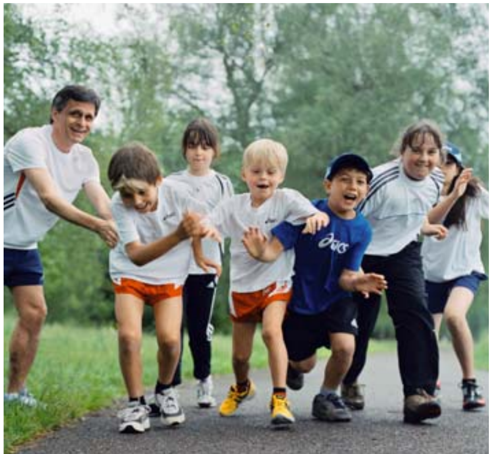
Sport lehrt Kinder unter anderem auch in Wettkämpfen fair zu bleiben.

einen Beitrag an unsere Gesellschaft. Getreu unserer Leitidee: «Für die Jugend, den Sport und die Schweiz liegt uns viel daran, die Lebensschule Sport so positiv wie möglich mitgestalten zu können, um den Jugendlichen einen erfolgreichen Weg in die Zukunft aufzuzeigen. Wir freuen uns, mit diesen Förderbeiträgen jungen Talenten eine Perspektive zu bieten.» Insgesamt investierte die Sporthilfe im Jahr 2006 mehr als 2 Millionen Franken in den Schweizer Nachwuchssport.