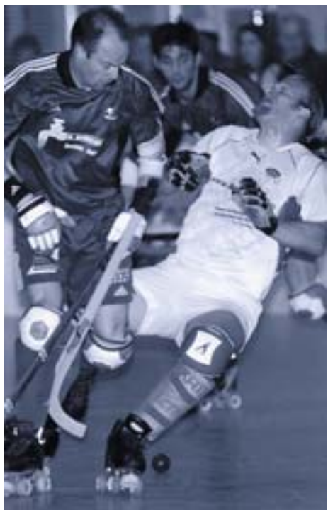
Einsatz und Teamgeist machen das Schweizer Team aus.

spielen, heisst mit Leidenschaft bei der Sache zu sein. Erfolge werden mit einer schwierigen Ausgangslage ganz anders gewertet. Die Frauennationalmannschaft organisierte die Hälfte der Kosten für die Teilnahme an der WM 2006 in Chile selbst. Der Teamgeist und die Tradition des Sports spornen zu Höchstleistungen an.»