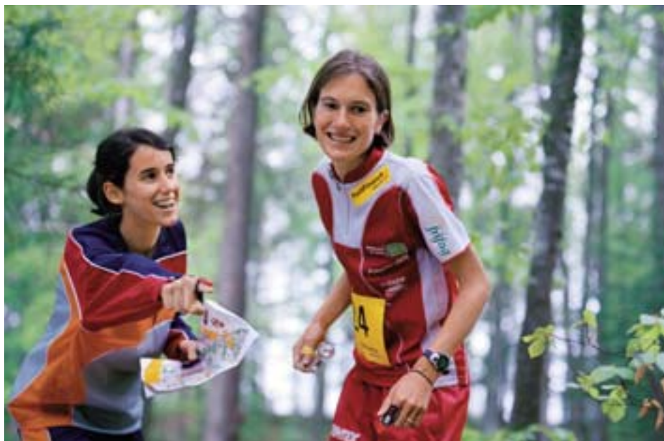
Simone Niggli-Luder sagt Ja zum Sportnachwuchs – mit einer Patenschaft und ihrem Engagement für den Sporthilfe-Kalender.