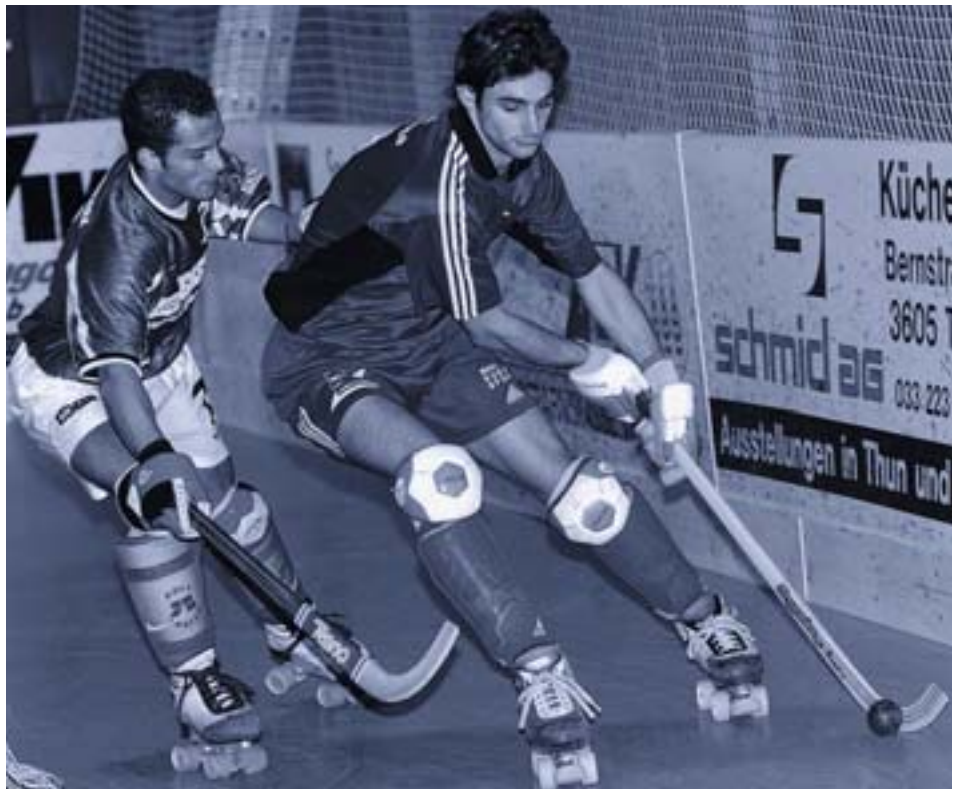
Die Schweiz gehört im Rollhockey-Sport zu den Besten.

Konkurrenz des medial viel präsenteren Fussballs oder Eishockeys zu gross. So haben sich mit dem Berner Oberland und der Region am Genfersee zwei Ballungszentren gebildet. Insgesamt existieren in der Schweiz nur 11 Rollhockey-Hallen, die für einen Verein Bedingung sind, um in der obersten Liga mitspielen zu können.